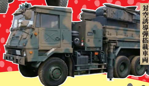
八一式短距離地対空誘導弾搭載車両