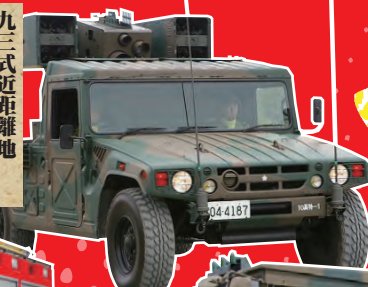
九三式近距離地対空誘導弾搭載車両