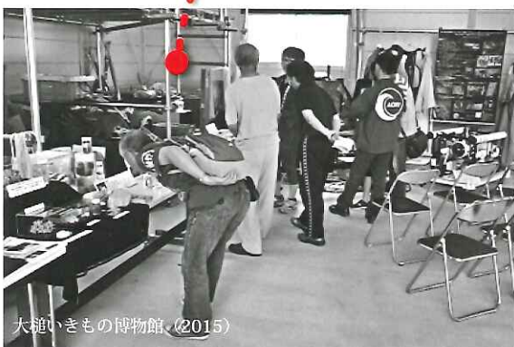
大槌いきもの博物館 (2015)