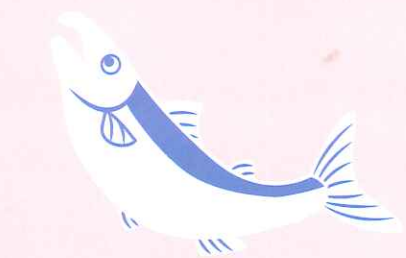
Oncorhynchus keta シロザケ