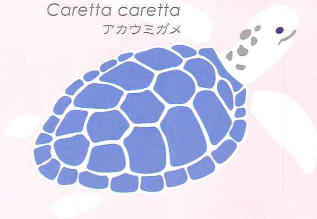
Caretta caretta アカウミガメ