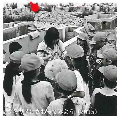
ウミガメにさわってみよう (2015)