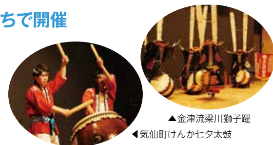
▲金津流梁川獅子躍 ◀気仙町けんか七太鼓