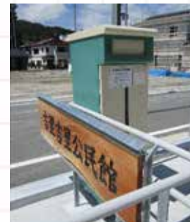
【吉里吉里分館のブックポスト】

「大槌町図書ボランティアこのゆびとまれ」にご協力いただき、読み聞かせ会を開催します。