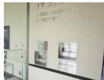
【おしゃっちエントランスのブックポスト】