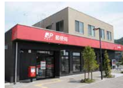
☎ 大槌郵便局 Tel 0193-42-2132