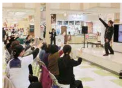
介護予防レクリエーションの様子

クラフトバンド、絵手紙、かな書道の展示も多くの方にご来場し鑑賞いただきました。ありがとうございました。