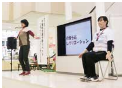
大槌ぴんころ体操の様子