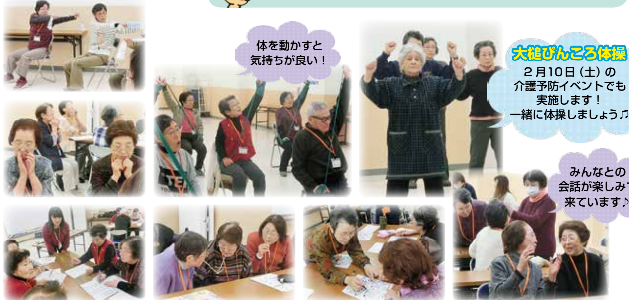
体を動かすと気持ちが良い!

リハビリの先生(理学療法士・作業療法士)や歯科衛生士などの専門の先生にも講師をお願いしています!