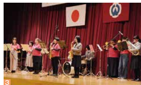
3 大槌高校とウインドオーケストラのステージ 4 サプライズで登場した恩師 5 会場を沸かせたスライドショー

平野町長は、式辞の中で「自らの感性を磨いて、さらに成長して行ってほしい」と新成人を激励しました。 成人式実行委員の皆さんが進行役をつとめた第2部のアトラクションでは、大槌高校吹奏楽部と大槌ウインドオーケストラが新成人を祝って演奏。また東北楽天ゴールデンイーグルスに所属し、新成人と同学年にあたるオコエ瑠偉選手から、激励のメッセージが届き、紹介されました。小中学校時代の思い出の写