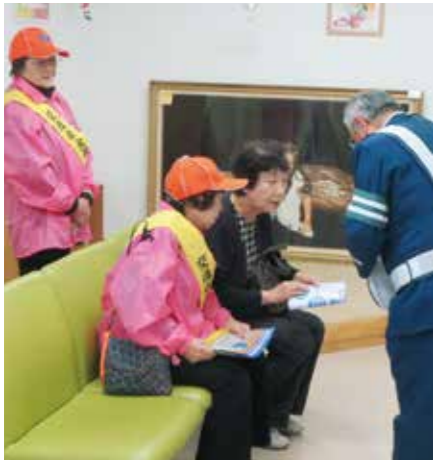
町内の病院で反射材を配布

岩手県内では、10月25日現在で交通事故による死者の数は48人。そのうち23人が高齢者で、13人がドライバー、10人が歩行者となっています。特に、薄暮時間帯から夜間にかけて高齢者が関わる事故、なかでも歩行中、自転車走行中の事故が多く、町は、10月17日から10月31日までの高齢者の交通事故防止県民運動期間に合わせ、高齢者へ反射材の着用を推奨する運動を展開。病院などで、訪れた高齢者に反射材を配布しました。また、釜石警察署など関係機関においても、老人クラブ連合会などと連携し、高齢者向けの安全講習を開催し啓発を行っています。