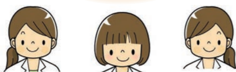
保健師 主任ケアマネジャー 社会福祉士