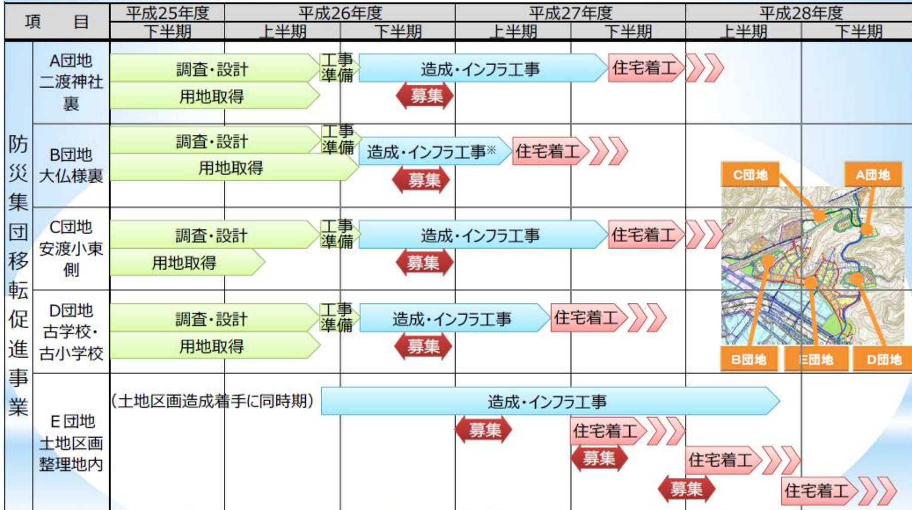
安渡地区防災集団移転促進事業