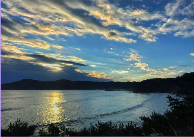
(おおつちInstagramキャンペーン1位受賞写真)

一年を通して多くのサーフィンを楽しむ方が訪れており、SUPA 公認インストラクターによる SUP レッスンも行われています。