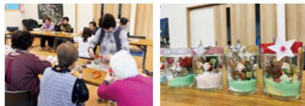
☎ 認定NPO法人遠野山・里・暮らしネットワーク: Tel.0198-62-0601

※これらの活動は、「令和元年度大槌町心の復興事業補助金」を活用し、実施されているものです。令和2年度大槌町心の復興事業は、1月中旬に募集する予定です。応募方法等の詳細は、コミュニティ総合支援室までお問い合わせください。