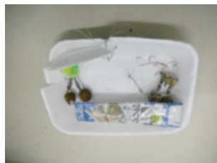
※1 資源ごみに混入した釣り針

資源ごみに資源とならないごみや、汚れてリサイクルできないごみ、釣り針など危険なごみ（※1）が同じ袋の中に入った状態で集積所に出されていることが見受けられます。リサイクルセンターにおいて回収したごみを手作業で選別（※2）し、資源として出荷（※3）していますが、選別作業に時間がかかったり、針や刃先の尖ったものが混ざると作業中にけがをしたり危険ですので、お手数をおかけしますが、ごみの分別についてご理解とご協力よろしく申し上げます。