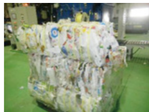
※3 圧縮して資源物として出荷