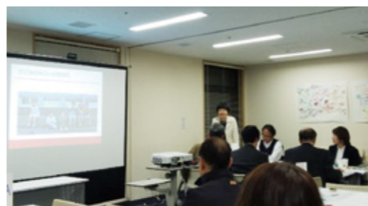
コミュニティスクール