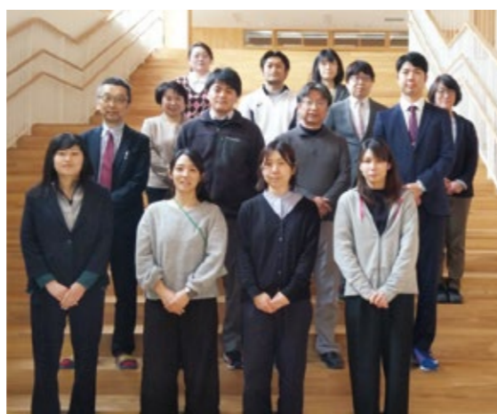
※写真については、全員ではありません。ご了承ください。