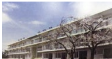
品川区立豊葉の杜学園

を教育のグランドデザインとして進めていることなど、実際の具体例を伺うことができました。児童生徒のために地域一丸となって学校と家庭と共に進めていくことの大切さを改めて考える研修会となりました。