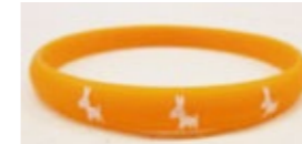
サポーターの証「オレンジリング」