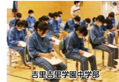
吉里吉里学園中学部