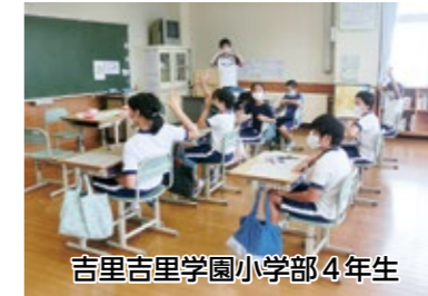
吉里吉里学園小学部4年生