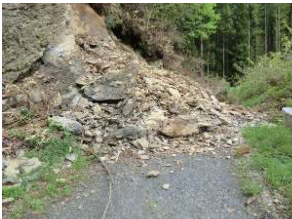
【五本松峠線 法面崩壊】