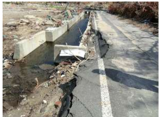
【吉里吉里線 舗装破損】