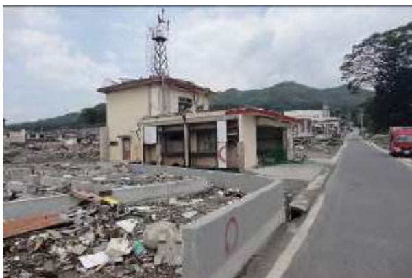
【第3分団第1・2部屯所（吉里吉里地区）】