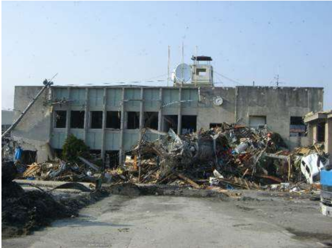
被災後の大槌町役場（H23.3.19 撮影）