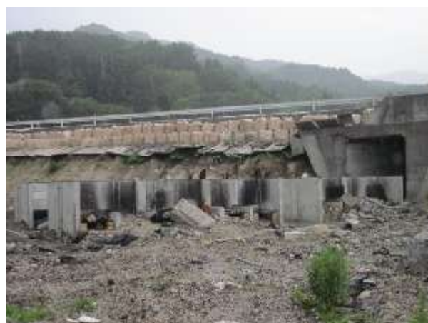
【国道45号線(浪板地区)】