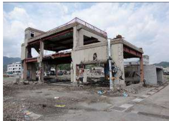
【消防会館：団本部・第1分団第3部屯所 （大町、須賀町地区）】