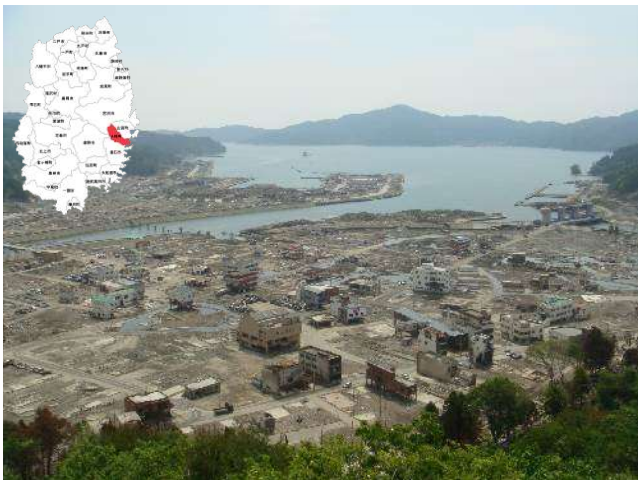
【被災した中心市街地（大槌町城山公園体育館駐車場から）】