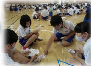
名刺交換をする子ども達