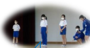
説明をする 4年学年執行部