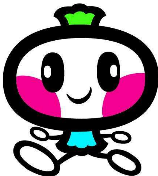
大槌町キャラクター 「おおちゃん」

おおちゃんは1994（平成6）年、全国から公募され、誕生しました。町のイニシャルの「O」と、「打ち出の小槌」を素材に、愛らしい表情を組み合わせてデザインされた男の子です。イメージカラーとして、「海と空」を表現するブルーを基調に、「自然と安心」を表すグリーン、「飛躍」を示すレッドが採用されました。