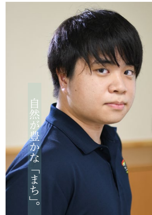
自然が豊かな「まち」。