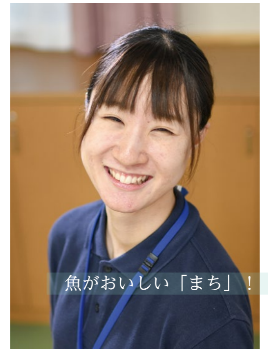
魚がおいしい「まち」！