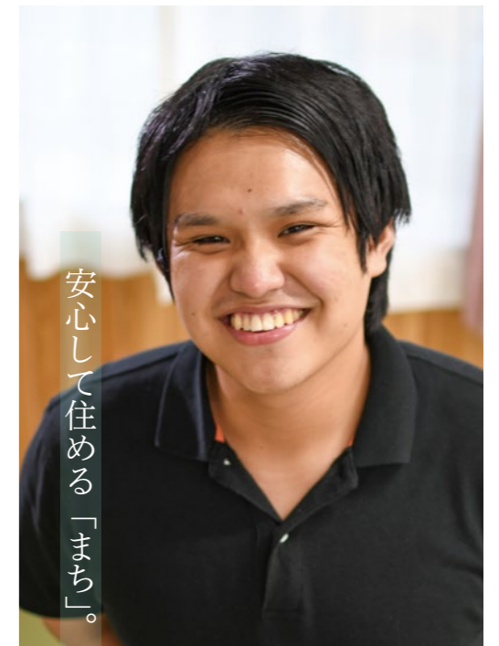
安心して住める「まち」。