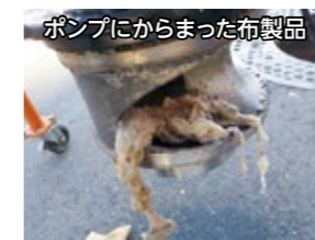
ポンプにからまった布製品

町の下水道施設では、ふきんやタオルなどの布製品が流れてきて、ポンプ設備にからまり、機能が停止する事故が多発しています。その頻度は1年間で20回