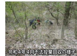
令和4年4月不法投棄回収の様子

個人が不法投棄をした場合、5年以下の懲役もしくは1000万円以下の罰金、またはその両方。法人が不法投棄をした場合は3億円以下の罰金刑と規定されています。