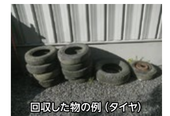
回収した物の例(タイヤ)