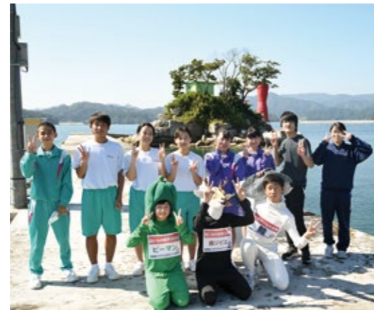
9月の炎天下に行ったCM撮影は、ひょうたん島、おしゃっち、大槌駅など町内各所で