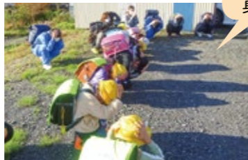
大地震発生！身を守ります。

子どもたちは、自分で身を守る体勢（ダンゴムシのポーズなど）をとって安全を確認した後、今いる場所から一番近い避難場所に移動しました。