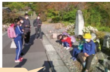
落ち着いて行動できました！