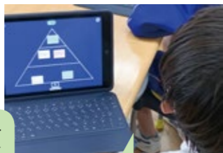
タブレットも 使いこなしているよ