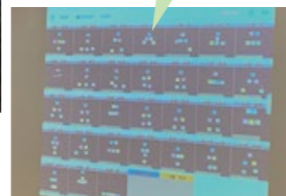
みんなの意見を、まとめて 電子黒板で見ることができます