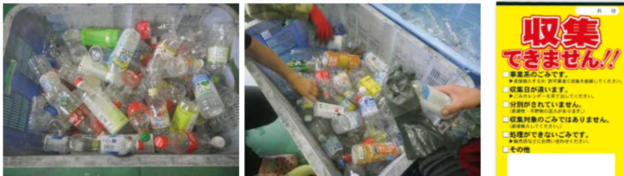
上町地区でゴミステーションに出されていた出し方・分け方のルールが守られていないペットボトル

ペットボトルのキャップとラベルをはがしてプラスチック製容器包装に出しましょう。出し方や分け方のルールが守られないと、資源にならない場合があります。皆さんのご協力をお願いします。