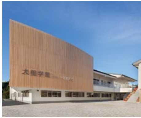
小中一貫教育校 大槌学園