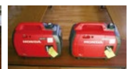
防災インバーター発電機