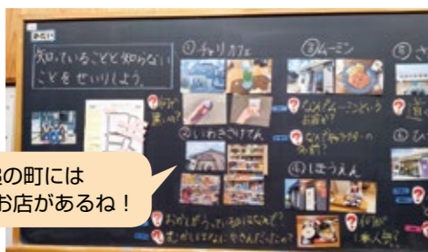
大槌の町には いろんなお店があるね!

大槌町内のお店にどんなものがあるか、どんな人が働いているかを調べました。自分たちの知らないことがまだまだたくさんあることが分かり、2回目の町たんけんインタビューすることをみんなで話し合いました。