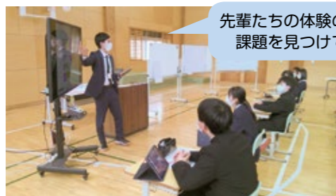
先輩たちの体験の記録から 課題を見つけてみよう

町の指定避難所にもなっている学園では最上級生である9年生が、災害時に地域の一員として行動できるように避難所運営訓練を行っています。その訓練を実施するにあたって、「自分たちができることは何か」を考え、授業の中で一人一人が意識を高めることができました。