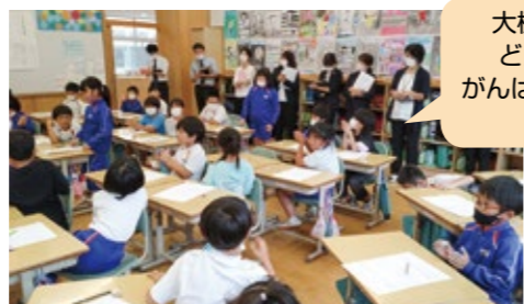
大槌のために、 どんなことを がんばっているかを 聞こう