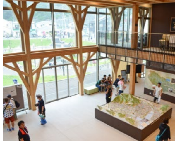
文化交流センター「おしゃっち」は今年 8 月、日経新聞の「美しい現代の木造建築（競技場・学校・公共施設）」で 2 位に選ばれた。復興と支え合いを地域材で表現したと評価