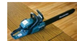
エンジンチェーンソー