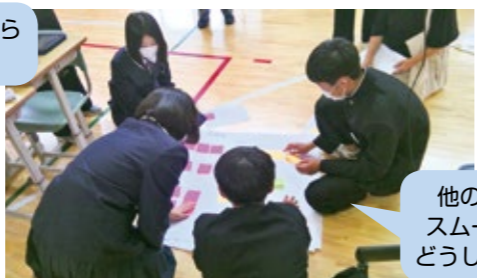
他の係との連携を スムーズにするには どうしたらいいだろう