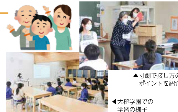
▲寸劇で接し方のポイントを紹介

この講座では、認知症の症状や、対応する際の気配りなどの学習を通して、誰もが暮らしやすい町づくりを進めています。開催の希望があれば、お気軽にお問い合わせください。