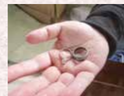
焼け跡から出てきた指輪