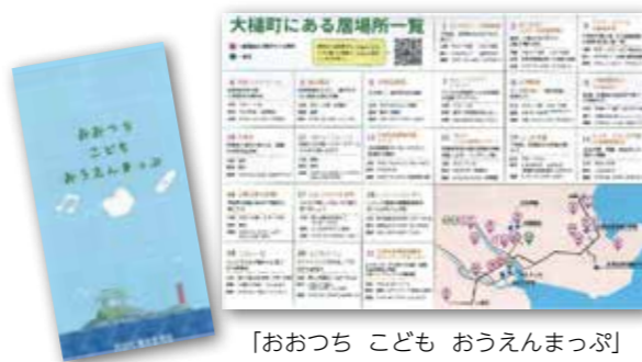
「おおつち こども おうえんまっぷ」

大槌学園前期課程・吉里吉里学園小学部の家庭に「おおつち こども おうえんまっぷ」(子どもの居場所として受け入れ可能な施設の地図)を配布し、子どもの居場所について周知するとともに、OLAIや吉里っ子スクールによる学習支援をはじめ、カタリバによる5・6年児童対象の夏期学習会、中央公民館赤浜分館や吉里吉里分館の開放や体験学習、東京大学大気海洋研究所「おおつち海の勉強室」の見学の受け入れなど、夏休みならではの企画をたくさん実施していただきました。