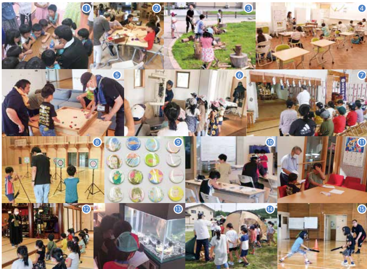
①理科実験教室 ②裁縫教室 ③新割り体験 ④学習会 ⑤ボードゲーム ⑥屯所見学 ⑦神社作法教室 ⑧スポーツ吹き矢体験 ⑨缶バッジづくり ⑩木工教室 ⑪紙飛行機づくり ⑫座禅体験 ⑬「海の勉強室」見学 ⑭テント張り体験 ⑮スポーツチャンバラ体験

今回の子どもの居場所づくりにあたり、依頼を快く引き受け、ご協力いただいた皆様に心より御礼を申し上げます。このような機会を機に、「地域で子どもを育てる輪・見守る輪」がさらに広がっていくことを期待しています。