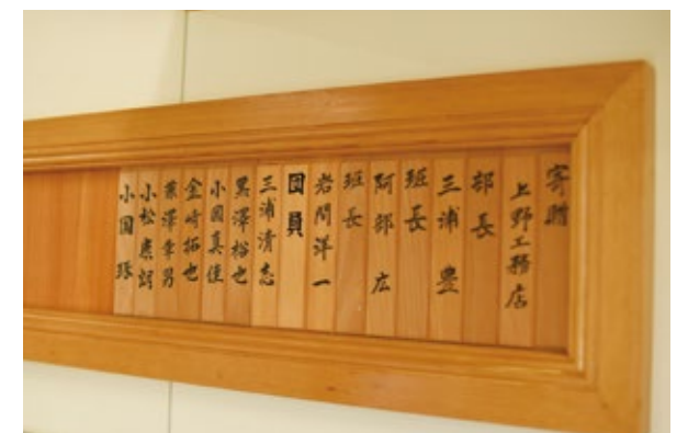
屯所に飾られている名簿。多世代の上下のない付き合いが団の魅力だという ※新入団2名の名札は制作中

消防団が大きな力となるのは、それが地元の人たちによって組織されているからです。地域を良く知る団員たちの活動は、住民に安心を与えます。かつて、大槌ではサイレンがなると、消防団員でない地域の人が屯所のシャッターをいち早く開けてくれていたそうです。それほどまでに、一人ひとりが自分の事として地域のために動いていたという事。「自らの地域は自らで守る」消防団の姿を通して、私たちそれぞれが、地域でできる事を考えてみましょう。