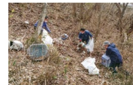
令和3年4月不法投棄回収の様子

町は毎年4月、道路脇にある不法投棄物の回収および不法投棄パトロールを行っています。また、4月に大槌河川漁業協同組合が小釜川で320kg。一ノ渡地域の環境を守る会が小釜第13地割小釜神社古宮周辺で30kg。5月に一般社団法人三陸ひとつなぎ自然学校が、白石地区の県道沿いで930kgのごみを、清掃活動により回収していただきました。