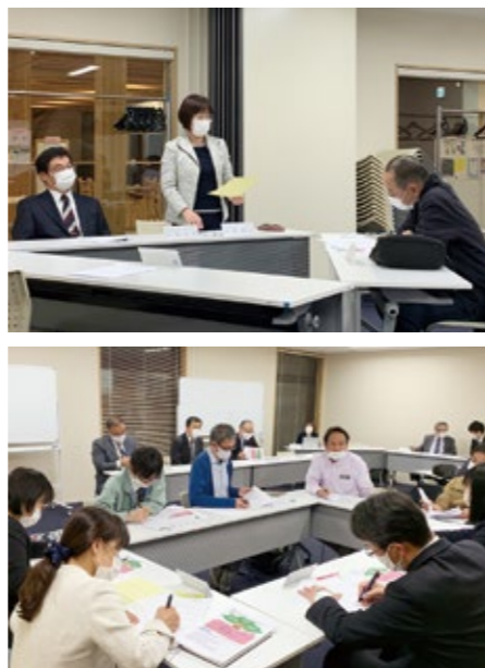
第1回コミュニティ・スクール委員会の様子