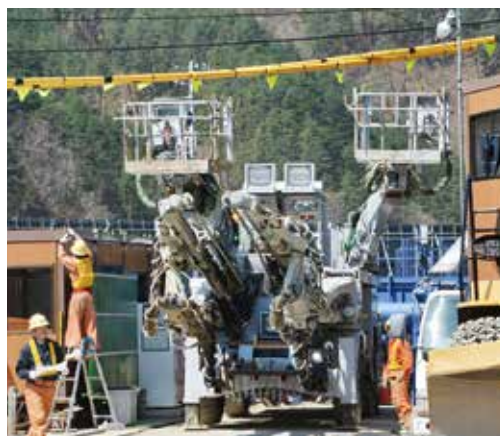
掘削機械 ドリルジャンボ

セスが円滑になるとともに、消防署からの救急搬送にも大きな効果が期待されます。平成31年3月の完成を目指し、工事を進めます。