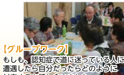
【グループワーク】もしも、認知症で道に迷っている人に遭遇したら自分だったらどのように対応するか話し合いました

認知症に対する正しい理解を深め、ご近所同士の交流や見守り等を促進する目的で、平成28年度から開催しています。今年度第3回目は、大ケ口多世代交流会館を会場に、地区住民や高校生など警察、消防団など協力者も含め47名にご参加いただき、10月6日(土)に開催しました。