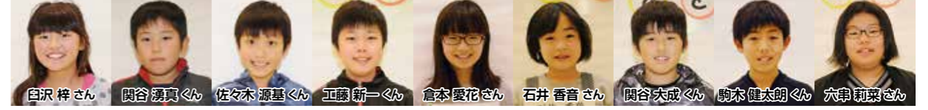
※表彰式参加者のみ掲載