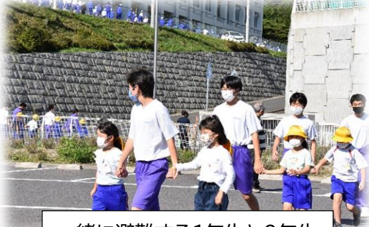
一緒に避難する1年生と9年生

618名の児童生徒を安全に素早く避難させるために次のように行いました。3～6年生は体育館脇に設置されている高校と学園をつなぐ非常階段を通して避難しました。1・2年生と7～9年生は学園前の横断歩道を通して校庭まで避難しました。その際、1年生のお世話を9年生が、2年生のお世話を8年生が行いました。前期児童と後期生徒が手をつないで避難訓練を行ったのも初めてです。