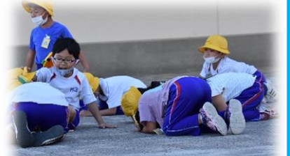
ダンゴムシのポーズをとる1年生

2つめは、【大津波警報が発令。より高い場所を目指し、大槌高校校庭へ2次避難する。】この大槌高校への避難は、PTA役員さんからの「想定外のことが起こったのが東日本大震災です。さらに高い場所へ避難する訓練をしてほしい。」というご意見を受け実施しました。