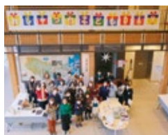
12/4に開催された「おしやつちこどもデイ」