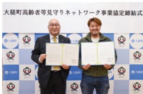
令和4年1月に協定締結いただいた際の写真です。(MOMIJI株式会社様)