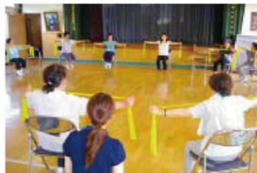
安渡公民館で行われたお元気教室