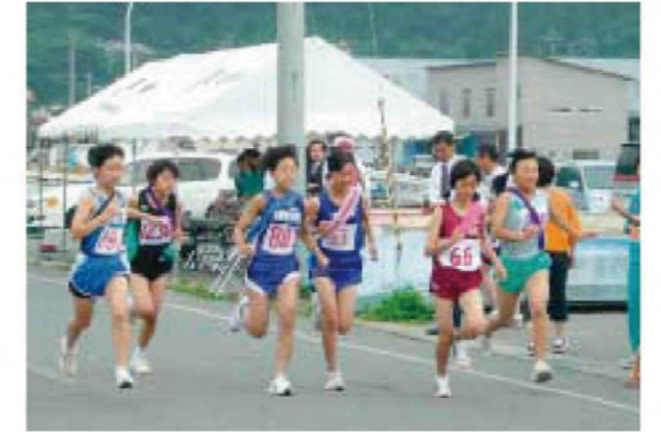
力走する選手たち