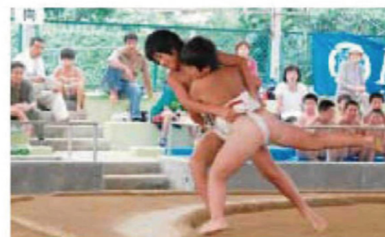
ちびっこ力士の白熱した取り組み

大槌町少年相撲大会は、先月3日、大槌町相撲場で開催されました。大会には、町内の小学校から団体戦に12チーム、個人戦に45人が参加。ちびっこ力士が力強い取り組みを繰り広げました。