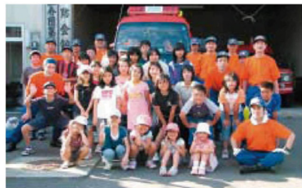
交流を深めた児童と団員の皆さん