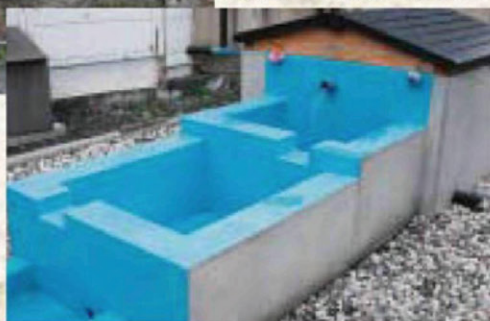
御社地公園付近にあるきつつ

町方の小路沿いの水路に、「きつつ」と呼ばれる湧き水を溜めておくためのコンクリート製やステンレス製の四角い箱型の枠(古くは木製の枠)が据えられているのを目にします。(現在はポンプで汲み上げているのが多い)