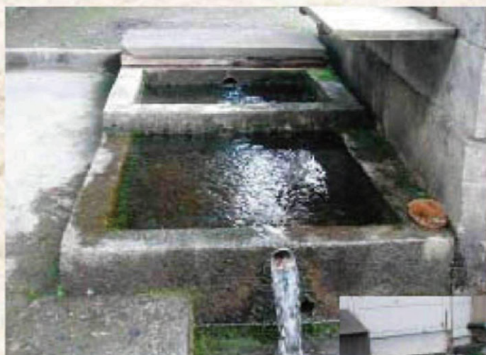
栄町地区にあるきつつ