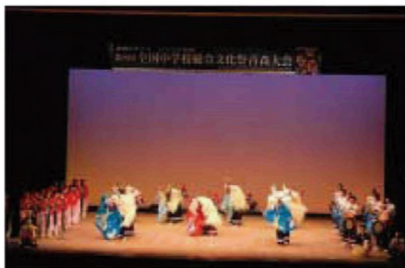
ステージで鹿子踊りを熱演する生徒たち

全国中学校総合文化祭は、先月19・20の両日、青森県弘前市民会館で開催され、岩手県からは吉里吉里中学校の3年生40名が出場し、伝統芸能の鹿子踊りを発表しました。生徒たちは、同地区の鹿子踊り保存会の皆さんから1ヵ月間にわたる指導を受け、本番に臨みました。発表後はその勇壮な舞に会場から大きな拍手が上がりました。