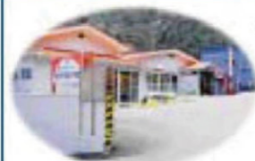
古廟坂 南部屋会館