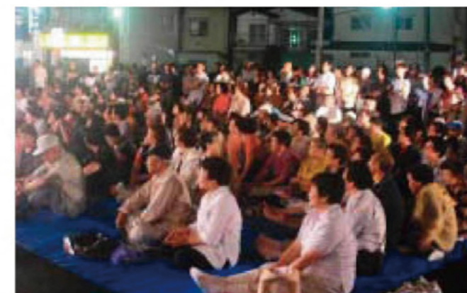
歌謡ショーに訪れた大勢の見物人

ラグー一行による合唱などが披露されました。辺りが暗くなり始めると、出店や絵燈籠などが明るく彩られました。人も次第に増え始め、赤浜弁天、向川原、安渡、城山の虎舞4団体による虎舞の競演に、見物人は見入っていました。