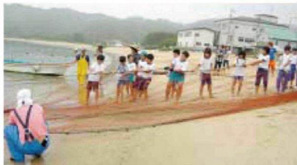
地引き網を体験する児童ら

9月には、吉里小の子どもたちが紫波町を訪問し、稲刈り体験などを通して、さらに友情と親睦を深めます。