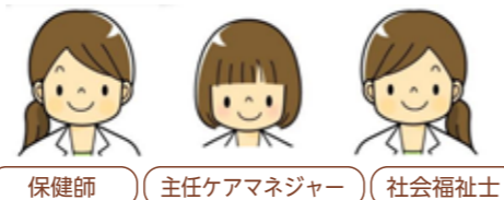
保健師 主任ケアマネジャー 社会福祉士