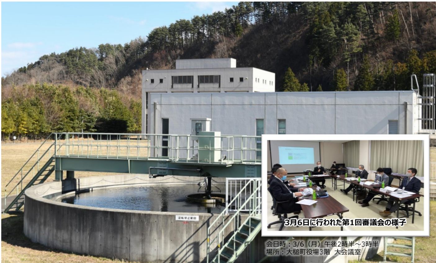
3月6日に行われた第1回審議会の様子