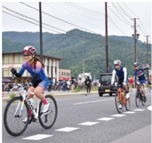
沿道からの声援に、笑顔で手を振る選手の皆さん