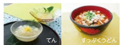
※写真はイメージ図