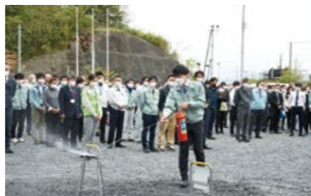
令和4年度に役場で行われた消防訓練の様子

大槌町役場庁舎の開庁（平成24年8月6日）から約10年にわたり、消防法に定める消防計画を作成していなかったことが判明しました。本来、施設の管理権限者は、防火管理者を定め、消防計画の作成、消防計画に基づく消火、通報および避難訓練の実施など、防火管理上必要な業務を行わなければならないと規定されています。