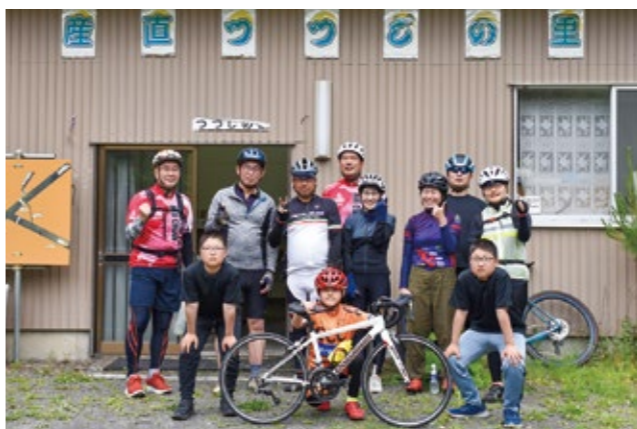
パレードを完走した皆さん、産直つじの里で記念撮影

レースに参加された人はお気づきになったと思いますが、スタート・ゴール、そしてゴールまで残りの表示標識を常設設置いたしました。自転車乗りの皆さん、いつ行ってもタイムアタックできますので、ぜひ新山に走りに来てください！