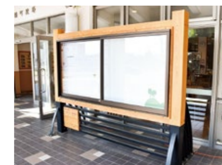
令和4年度に、町民の目に触れやすくするため、 新たに設置された掲示板

ただし、現状では、不備問題のあった条例、規則について、当初の施行予定日にさかのぼって施行する旨の規定が抜け落ちてしまっているものがある。これらについては、一定の手続きが必要である。