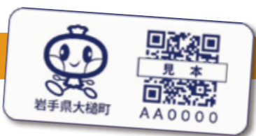
↑大槌町の見守りシール