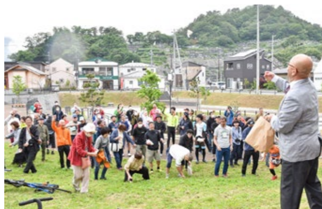
大槌恒例の餅まき、選手たちは疲れを見せず楽しんでました