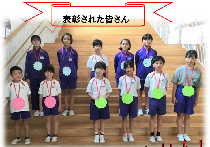
表彰された皆さん