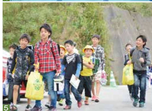
1 体育館 2 図書室「本の森」 3 ランチルーム 4 プール 5 笑顔で登校する子どもたち（9月26日）

新校舎は、県立大槌高校の旧グラウンドがあつた約2・5ヘクタールの敷地に、木造一部鉄筋コンクリート造り2階建ての校舎棟（延べ床面積約8870平方メートル）、屋内運動場棟（同3600平方メートル）、駐輪場棟（同380平方メートル）、木造平屋建てのプール棟（同200平方メートル）などが整備されました。一昨年12月に着工し、1年9カ月をかけて完成しました。整備事業費は約56億2千万円です。 校舎棟は、子どもたちが温もりある安全安心な環境で学べるよう、教室を中心に町産材を最大限活用して木造木質化が図られました。児童生徒や教職員が、新校舎への思いや、自分の夢や希望を寄せ書きした木の梁も活用されています。図書室「本の森」、2学年が一緒に利用できるランチルームなどが設けられたほか、防災倉庫や非常用発電機を備え、避難所機能も持つ防災拠点としての役割も担います。造成工事が進められているグラウンドについても、本年度内には完成予定です。