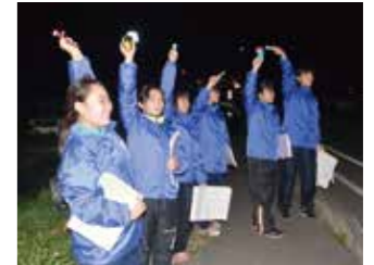
交流花火で大槌町を訪れた 平和中学校の生徒