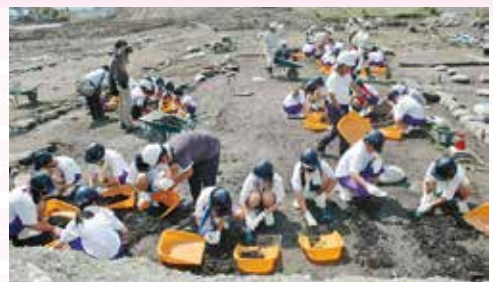
「ふるさと科」の授業の一環で、発掘作業を体験する大槌中学校(当時)の生徒=2014年7月

江戸時代、南部藩の代官所が置かれ、沿岸の中心都市として栄えた大槌町。町方にある旧商家の跡地「町方遺跡」からは、建物や水路の遺構、陶磁器の破片や銭貨などが発見されました。復興に向かう町の盛り土の下で、歴史が現在も息づいています。