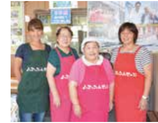
地域の憩いの場を支えてきた スタッフの皆さん

吉里吉里地区の「マリンマザーズきりぎり」が震災後の 2011年8月から運営してきた仮設食堂「よってったんせえ」 が、5年間の営業を終えて閉店しました。地元産のワカメを 使ったラーメンやカレー、加工品などを安く提供。地域住民 や観光客などから広く親しま れてきましたが、「『みんなを 笑顔にしたい』『人と人とが 会話をする声が聞きたい』『被 災地からの情報発信をした い』との当初の目的は達成で きた」との思いから、惜しま れながら閉店を決めました。