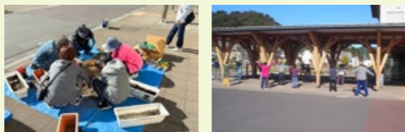
チューリップ球根の植え付け作業(すけっと隊)