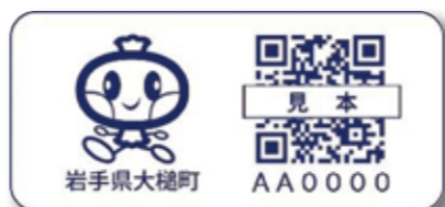
大槌町の見守りシール

おおつち見守りSOS ネット登録者で「どこシル伝言板」の利用を希望する人 ※QRコードが印刷されたシールを無料で配布します。