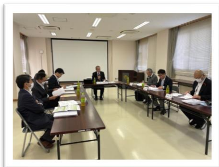
10月30日に行われた第4回審議会の様子