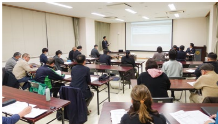
コミュニティ・スクール委員会の様子

令和7年12月に国が策定した「部活動改革及び地域クラブ活動の推進等に関する総合的なガイドライン」には、令和13年度までには土日の学校部活動は全て地域に展開され、併せて平日も推進することと明記されています。これをうけ町は、「令和11年8月末までに原則全ての休日の部活動は終了、地域クラブ活動への展開」を現時点での方針案とし、令和8年度より部活動指導員の配置、行政内推進体制の構築、推進協議会の設置、推進計画の策定など、本格的に地域展開に着手していきます。急激な少子化が進む中でも、将来にわたって子どもたちが継続的にスポーツ・文化芸術活動に親しむ機会を確保できるよう、ご理解とご協力をお願いします。