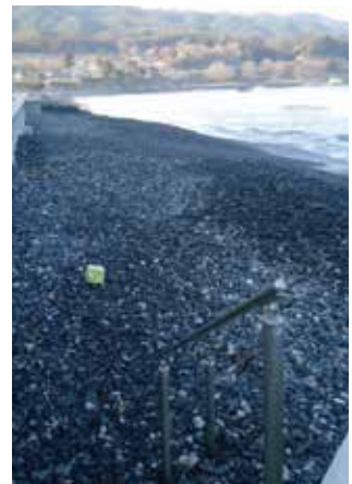
浪板海岸の砂利堆積状況

海岸全体に大量の砂利が堆積している現状は、十分に認識している。県に対し、これまでも地域住民の声を届けてきた。今後も、砂利撤去による利用環境の改善に向け、県と緊密に連携し、継続的な働きかけを行っていく。