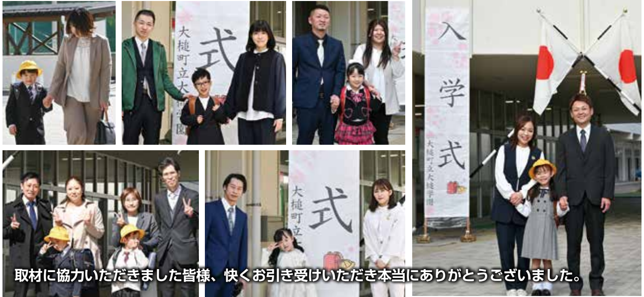
取材に協力いただきました皆様、快くお引き受けいただき本当にありがとうございました。