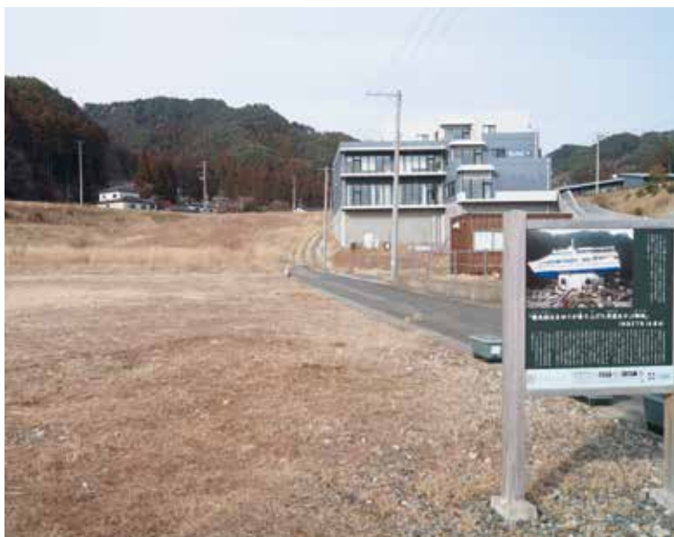
震災津波の事実と教訓を残す旧民宿あかぶ跡地

今後の取組は、関係団体と震災伝承、防災学習の視点のほか、地域に人を呼び込む際に必要な休憩設備等の議論を進めているところだ。その内容を踏まえ、議会へ説明し、令和8年度中に方向性を確定したい。