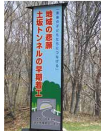
土坂峠に設置された 早期着工を願う看板

土坂峠トンネル化は、大槌山田紫波線道路整備促進期成同盟会及び町単独で、国・県への要望活動を継続している。今後も早期事業化に向け、息の長い要望活動を実施する。