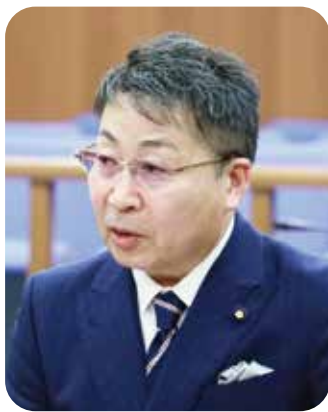
議員 池田 忠彦 議員