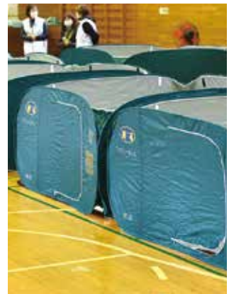
暑さ対策が急務となる 体育館等の避難所

昨年発生したカムチャツカ沖地震を踏まえ、重要な課題と捉えている。収容人数が多い体育館やホール等への空調整備の方向性を示す。スポットクーラーや非常用発電機の整備は、国の新たな交付金の活用を想定。全体の避難所の状況を考慮しつつ、整備に向けて取り組む。