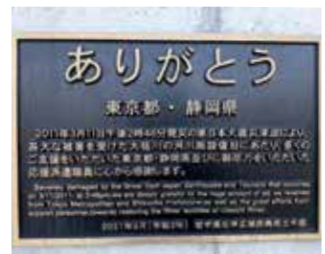
震災復興の支援に感謝

東日本大震災津波以降、ご支援をいただいた自治体や企業・団体と、これまで築いてきた関係性を生かし、これらのネットワークを通じて、町内イベント情報や体験メニューなど、当町の地域資源に関する情報を継