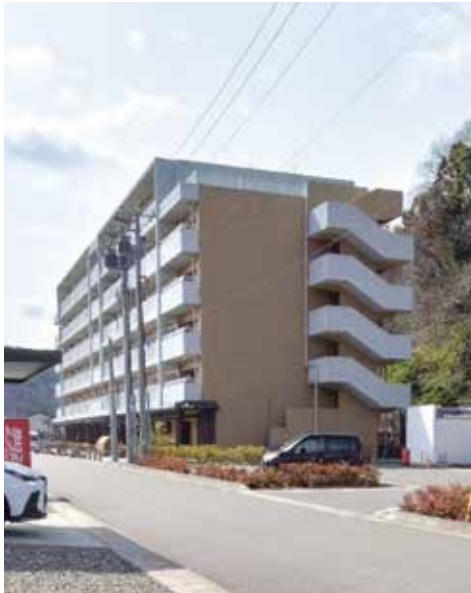
末広町災害公営住宅

また、社会福祉協議会が配置する生活支援相談員も定期的な訪問活動を行い、地域包括支援センターと連携し、必要に応じて専門的支援につなげる体制を構築している。