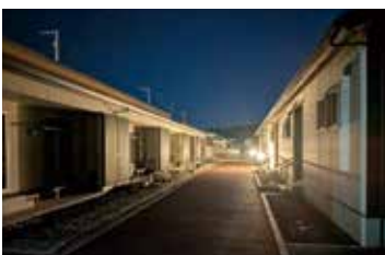
震災から15年目の朝を迎えた公営住宅

令和2年度から一般供用化を実施し、震災被災者以外の住宅困窮者への住宅の提供を行っているところだ。 近い将来においては、移住定住施策や子育て世代の支援を目的とした住宅への活用も視野に入れている。