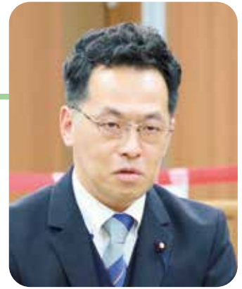
議員 佐々木 大作