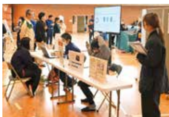
県総合防災訓練でのシステムによる受付デモ

現在、県が主体となり復興防災DX研究会を立ち上げた。取組の一つとしてLINE等のアプリを活用した「避難者把握システム」の実証試験が、令和7年11月の岩手県総合防災訓練で行われたところだ。社会実装は、令和8年度以降の予定となるため、当町も導入準備を検討を進めていく。