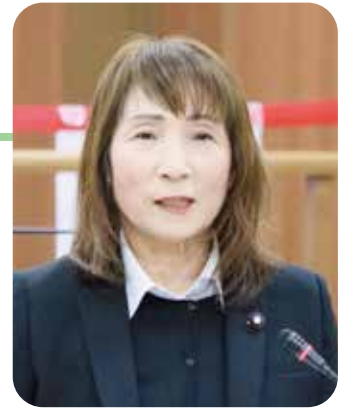
議員 山 美恵子 さわ やま み え こ