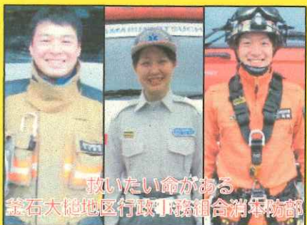
釜石大槌地区消防本部