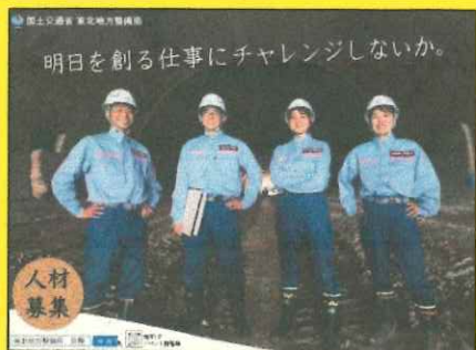
国土交通省 東北地方整備局

釜石市・大槌町6個団体がおしゃっちに大集合！ 職業・採用内容等について直接説明します！